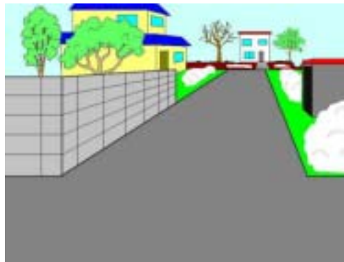
車庫の陰 塀の陰 交差点巻き込み 雪山

春の訪れとともに、子供達は戸外での活動が活発になります。住宅街の道路は、幅員が狭く見通し不良箇所が多いことから、安全確認をしっかりと行い、思いやりのある運転で事故防止をお願いします。